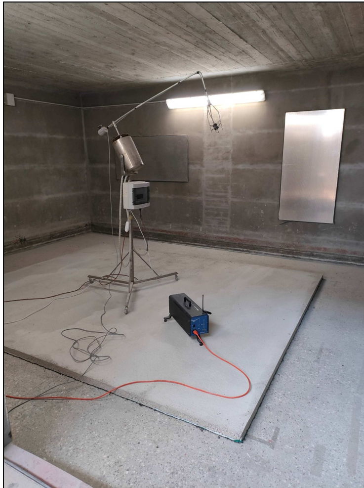
Fotografia dell'oggetto Photograph of item