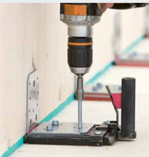
Elemento elástico ABAI 105

Los nuevos estándares Europeos constructivos exigen un aislamiento eficaz del ruido transmitido por vía aérea y de impacto. Además del aislamiento acústico contra el ruido exterior, también afecta al interior de los edificios. Para reducir al mínimo la propagación del ruido, la constructora se puso en contacto con Getzner como especialista en aislamiento antivibratorio. El resultado fue una solución excepcional a nivel acústico.